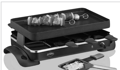
Raclette »GRANDE« 17 5500 00 00