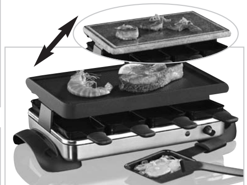
Raclette »EXCLUSIVE« 17 7000 00 00 Grillplaat & Steenplaat

Naargelang het model wordt uw raclette met een grillplaat, een steenplaat of beide platen geleverd.