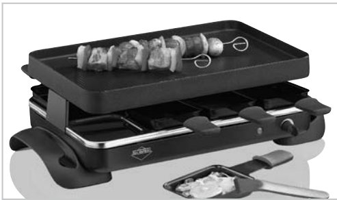
Raclette »GRANDE« 17 5500 00 00

This raclette device is a high-quality product and complies with the recognized rules of technology and the Equipment Safety Law. Please read these operating instructions thoroughly before using the device for the first time and store them in a safe place. Please follow the safety instructions!