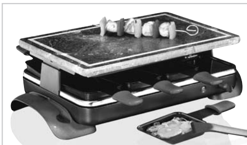
Raclette »HOT STONE« 17 4000 00 00

A seconda del modello, la raclette viene fornita unitamente a una piastra grill, a una piastra in pietra o comprensiva di entrambe.