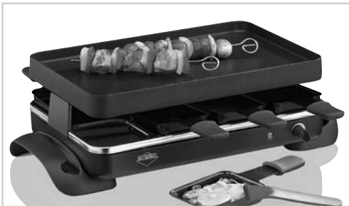
Raclette »GRANDE« 17 5500 00 00

Dieses Raclette- Gerät ist ein Qualitätsprodukt und entspricht den anerkannten Regeln der Technik und dem Gerätesicherheitsgesetz. Lesen Sie bitte diese Bedienungsanleitung sorgfältig durch und bewahren Sie sie gut auf. Bitte beachten Sie besonders die Sicherheitshinweise!