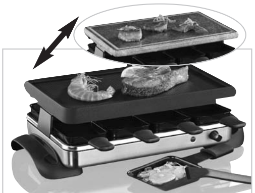
Raclette »EXCLUSIVE« 17 7000 00 00 non-stick grill plate & Hot stone