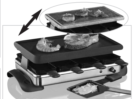
Raclette »EXCLUSIVE« 17 7000 00 00 Grillplatte & Heier Stein

Je nach Modell wird Ihr Raclette mit einer Grillplatte, einer Steinplatte oder beiden Platten geliefert.