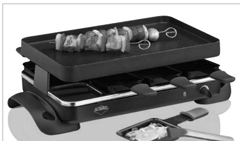
Raclette »GRANDE« 17 5500 00 00

Cet appareil à raclette est un produit de qualité conforme à l'état reconnu de la technique ainsi qu'à la loi sur la sécurité des appareils (Gerätesicherheitsgesetz). Nous vous prions de lire attentivement ce mode d'emploi et de le conserver soigneusement. Tenez notamment compte des consignes de sécurité !