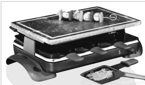
Raclette »HOT STONE« 17 4000 00 00