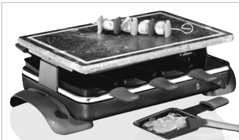
Raclette »HOT STONE« 17 4000 00 00