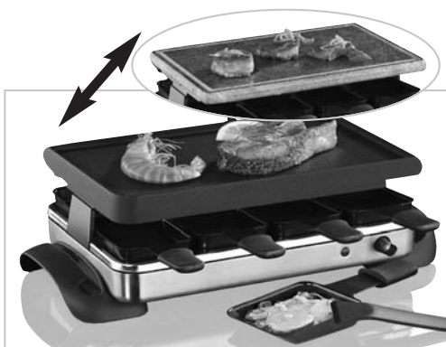
Raclette »EXCLUSIVE« 17 7000 00 00 plaque grill & Pierre chaude