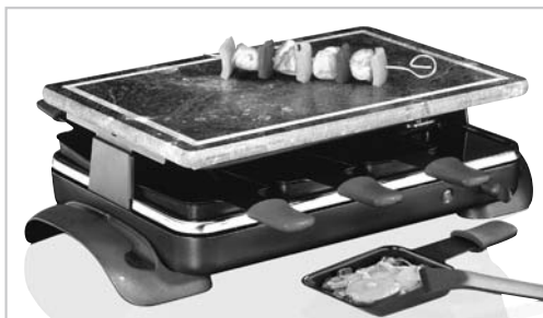
Raclette »HOT STONE« 17 4000 00 00

Selon le modèle, votre appareil à raclette est fourni avec une plaque grill, une plaque en pierre ou les deux accessoires.